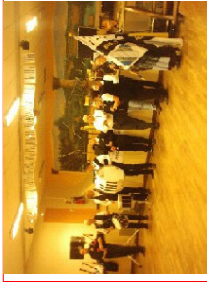
Le bagad Melen Ha Gwenn