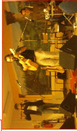
Le groupe AR skolpen